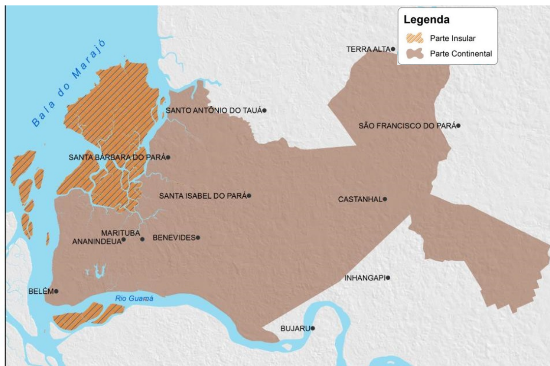
Figura 1: Região Metropolitana de Belém